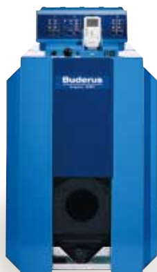
Logano G215 WS

Использование специального серого чугуна разработки компании Buderus обеспечивает высокую стойкость к коррозии при всех режимах работы, в том числе, и при низких температурах. Для наших котлов не существует ограничения минимальной температуры.