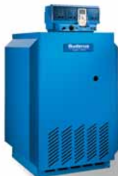
Logano G234 WS

Для него везде найдется место. Котел Logano G124 WS поставляется в полностью смонтированном состоянии, оборудованный системами автоматики и газовой горелкой предварительного смешения. Если он оснащается водонагревателем, который монтируется под котлом, для его размещения требуется площадь менее 1 квадратного метра. И при сжигании природного, и при сжигании сжиженного газа всегда достигается оптимальный результат.