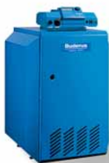
Logano G124 WS

Беспорным преимуществом газовых отопительных котлов G124WS и G234WS является возможность стабильной работы в газовых сетях с низким давлением, что весьма актуально для российского потребителя. Котлы работают без снижения мощности до подаваемого давления газа 10 мбар. При этом серии G124WS и G234WS сохранили основные качества, присущие котлам Buderus: надежность, экономичность, компактность и отличный дизайн. В них отсутствуют движущие элементы, которые легко подвержены износу. Поэтому объем технического обслуживания таких котлов является минимальным. Поскольку газ сгорает практически без образования нагара, необходимость в проведении работ по очистке также практически отпадает.